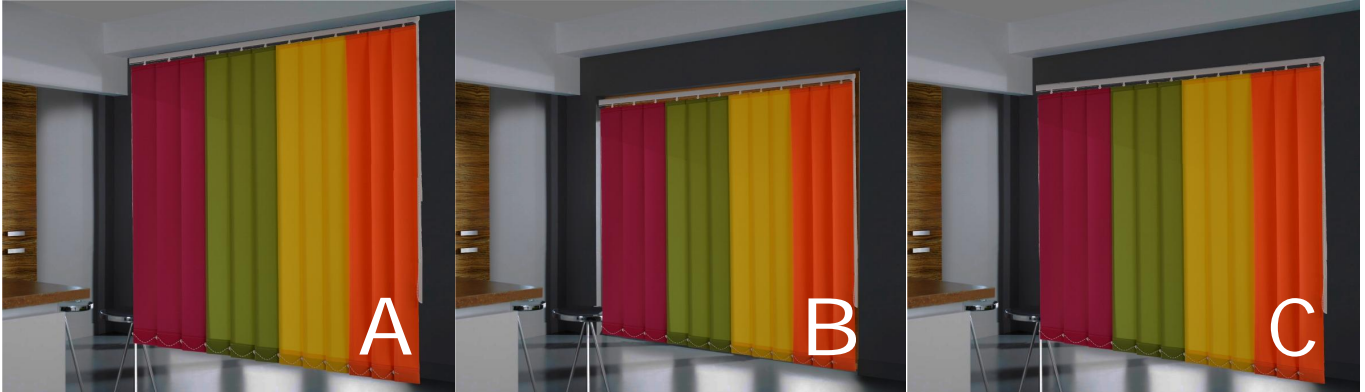
C - Montáž na stěnu